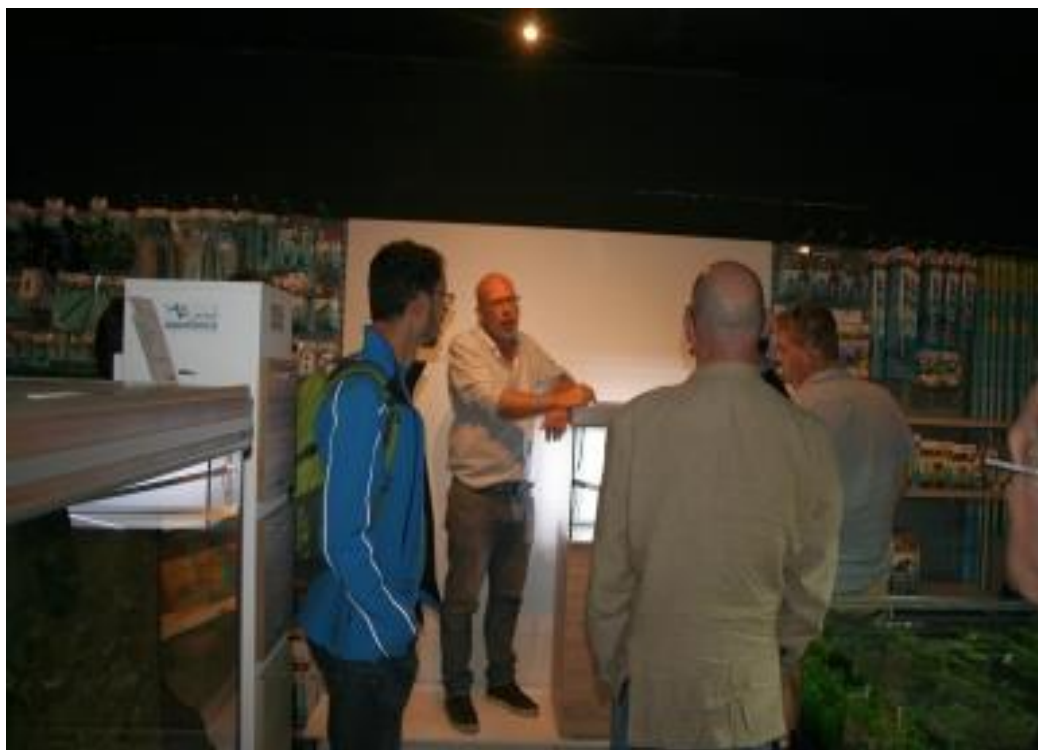
De eigenaar van Utaka aan het woord

Wij zijn een bedrijf met meer dan 30 jaar ervaring op het gebied van aquaria en hengelsport. Wij maken ons sterk voor een goede advisering, service en ondersteuning van de klant. In 2009 hebben we onze pand geheel vernieuwd. De hengelsportafdeling kan de recreatieve sportvissers met zo'n 3000 verschillende artikelen voorzien van alles wat nodig is voor een plezierige besteding van de kostbare vrije tijd. Hoofdmerken zijn Shakespeare, Mitchell, Berkley, Abu-Garcia, Demon Baits en Marcel van den Eynde. Graag tot ziens!