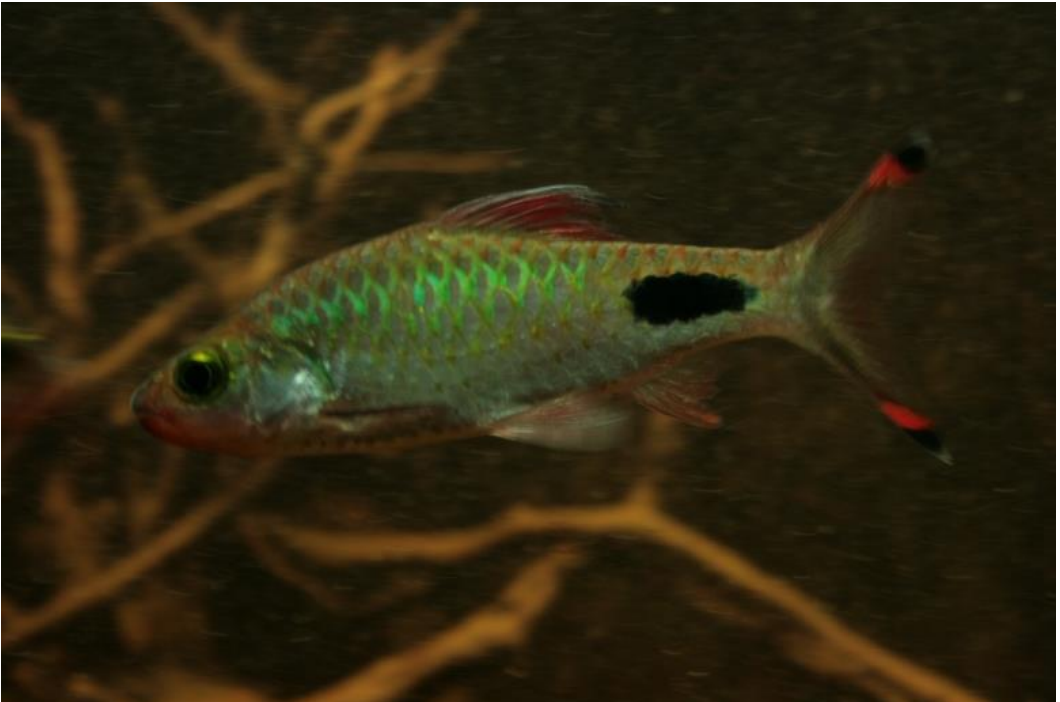
Foto's staan op de website onder multimedia Uitstapje Utaka en de Rifwachter.