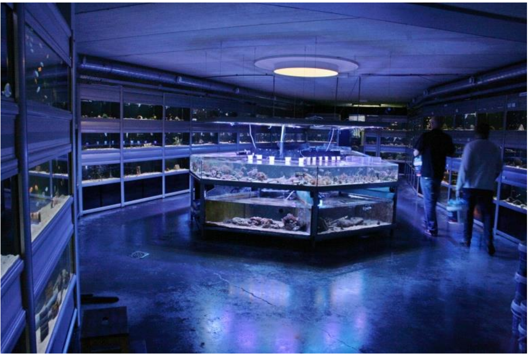
En de Rifwachter